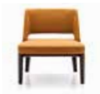
4 OWENS "ARMCHAIR" FAUTEUIL CM 72X72 H76