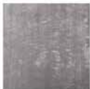
7 DIBBETS TAPIS CM 500X500